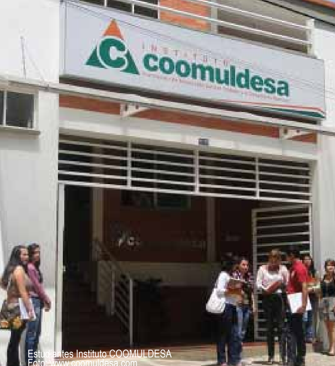
Estudiantes Instituto COOMULDESA

“El cooperativismo y la economía solidaria junto con nuestra identidad cultural y territorio son las variables a nuestro alcance para seguir construyendo un desarrollo más solidario que compite con el modelo basado en el desarrollo convencional”.