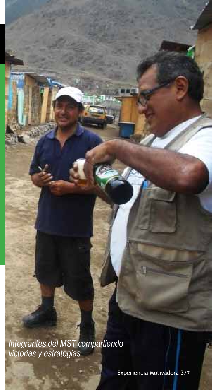
Integrantes del MST compartiendo victorias y estrategias