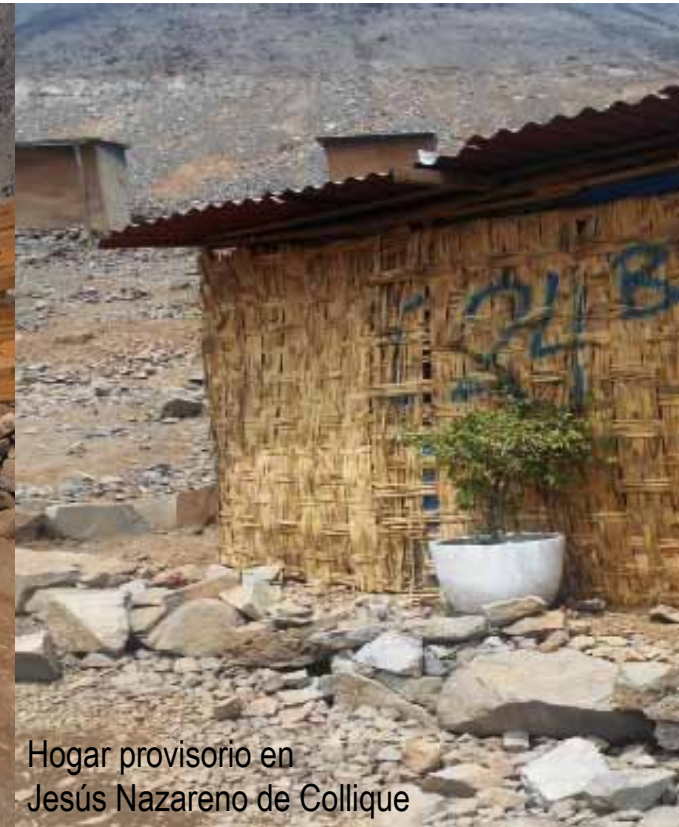
Hogar provisorio en Jesús Nazareno de Collique

“La gente es muy desconfiada por mucho engaño que han sufrido y es un logro muy grande que haya confianza en la organización. La compra entre todos ha permitido abaratar el costo. Lo mismo esperamos lograr en la construcción además de poder utilizar los materiales de la cantera”.