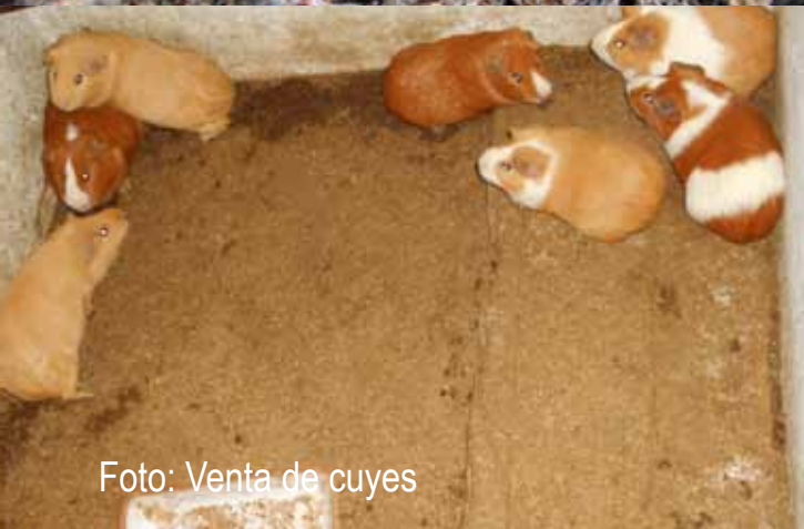
Foto: Venta de cuyes