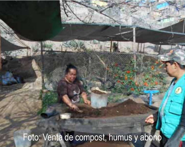
Foto: Venta de compost, humus y abono