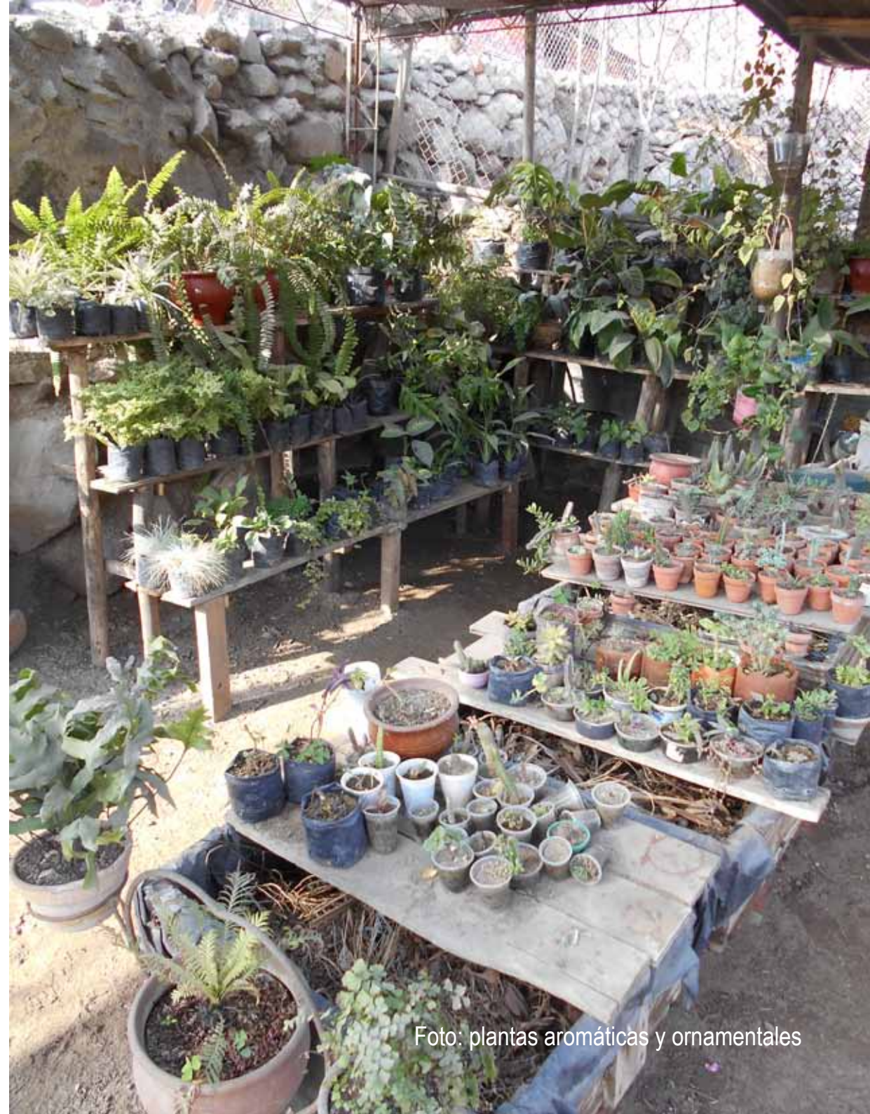
Foto: plantas aromáticas y ornamentales

Los volúmenes de producción de compost y humus alcanzan mensualmente hasta cuatro toneladas, utilizadas para las huertas y producción de plantas del centro, para la venta local y por mayor (el mercado de flores de Lima es el cliente mayor) y para áreas verdes de la zona. Donde se encontraban hace veinte años los basurales, se juega hoy partidos de fútbol, en cancha de pasto natural.