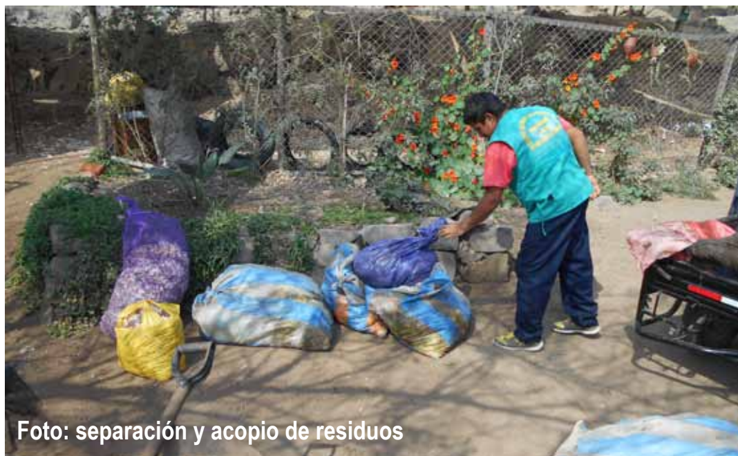
Foto: separación y acopio de residuos

Al principio era la parroquia la que apoyaba en ocasiones al centro; ahora era el centro mismo que lograba captar recursos de la cooperación internacional; gracias al apoyo de un programa nacional, auspiciado por la